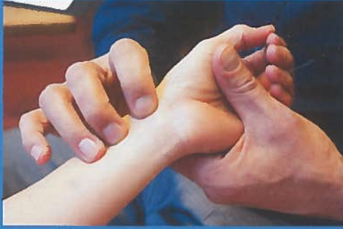
Een pols onderzoek behoort tot een van de verschillende onderzoeksmethoden.