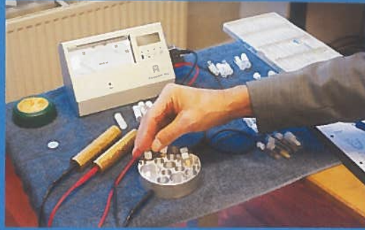
Een mesoloog zoekt als het ware naar de rode draad zodat hij weet waar hij bij moet sturen om het lichaam in staat te stellen het zelf op te lossen.