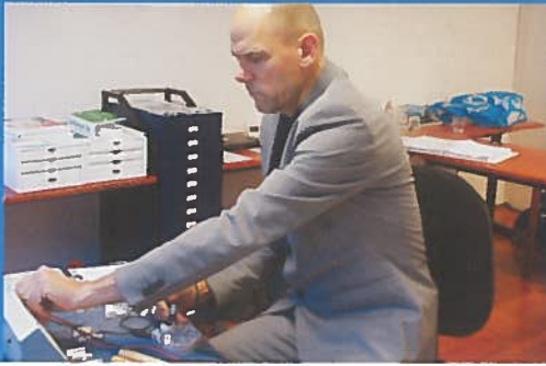
Door middel van Electro Fysiologische Diagnostiek worden de organen doorgemeten.